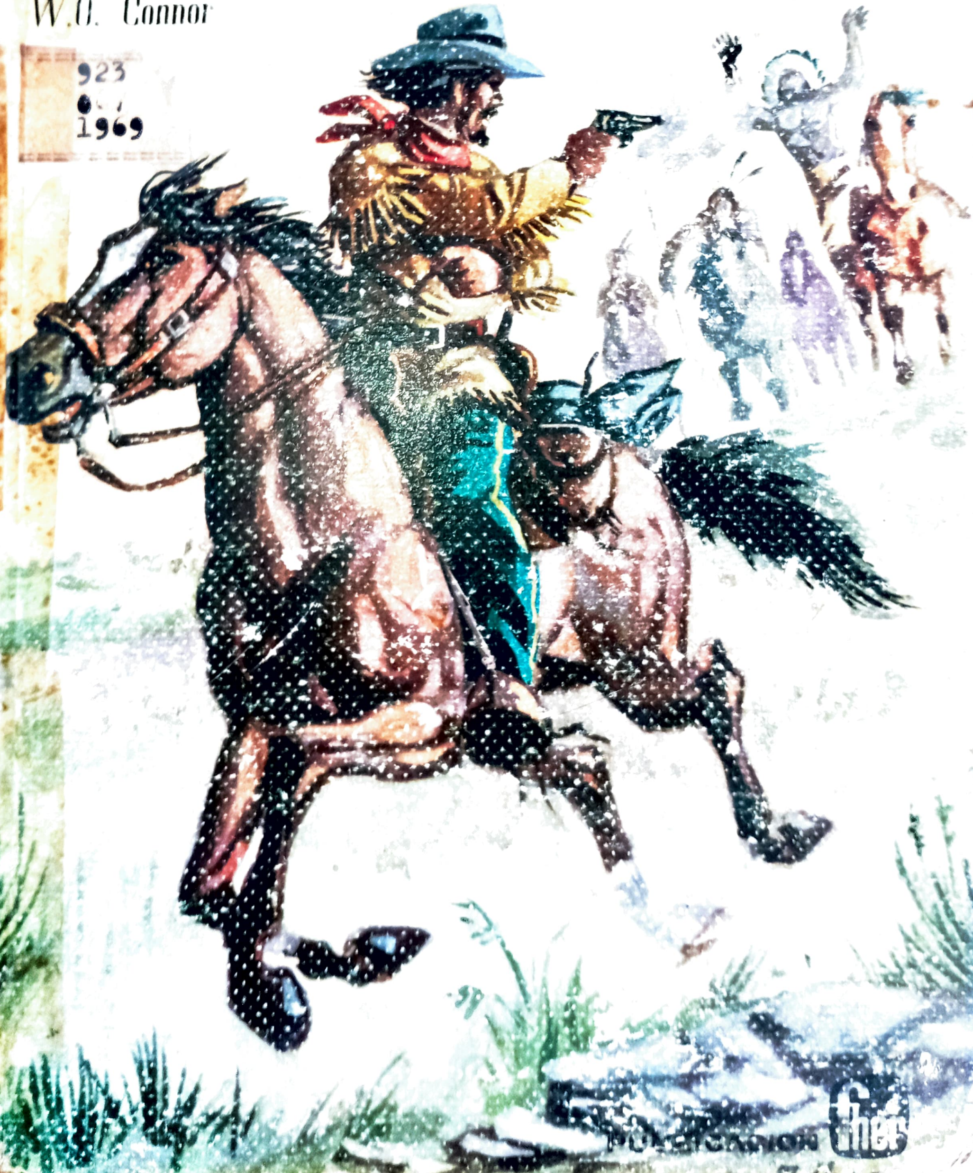
Illustration by the