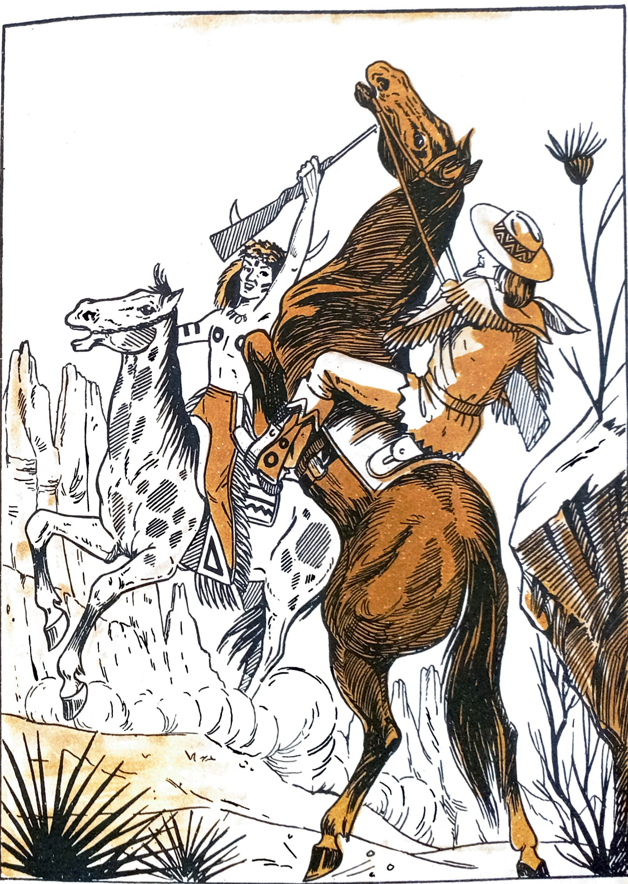
Los caballos dieron un brinco y se derrumbaron al suelo.